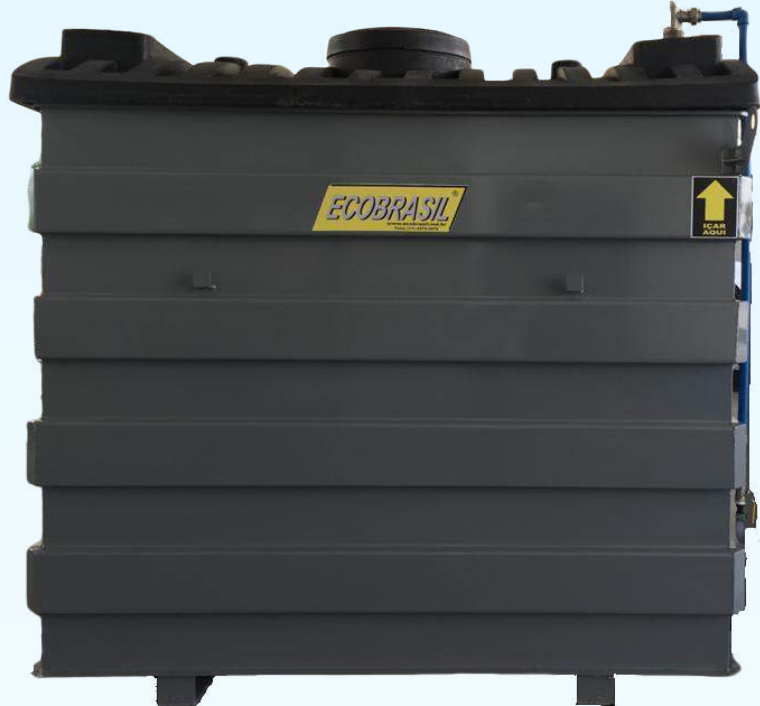
TANQUE ECOLÓGICO DUPLA PAREDE

Primeira contenção em polietileno de alta densidade de 6,0mm de espessura. Segunda contenção de segurança em aço carbono ASTM A 36 jateado e com pintura em PU.